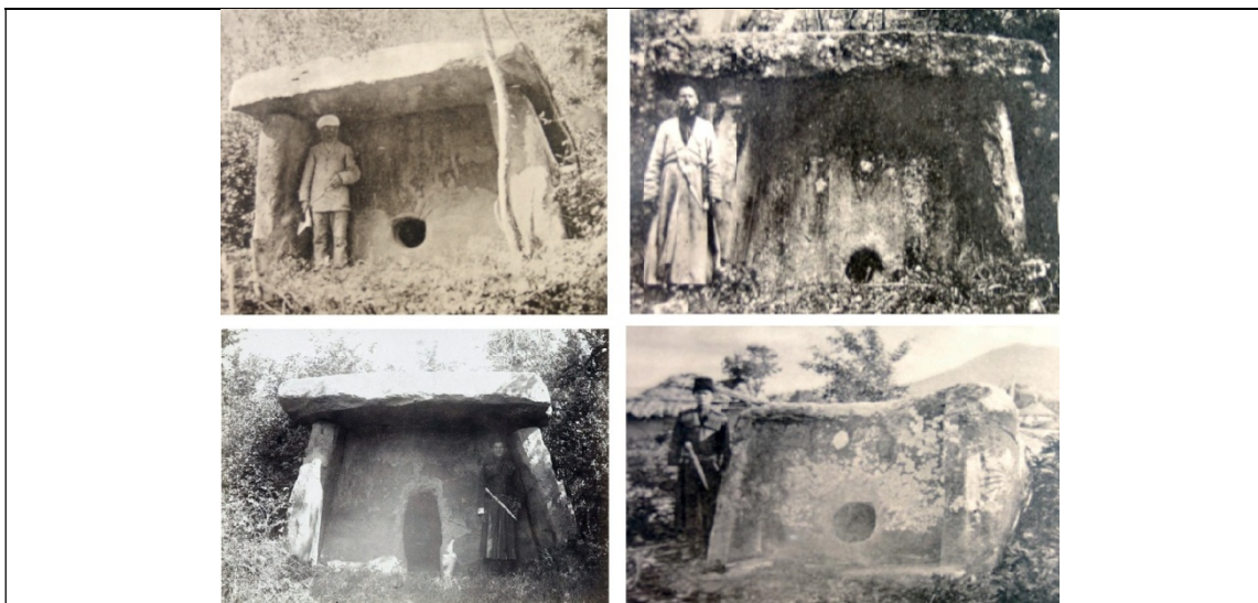
Рис. 2. Фотографии дольменов, сделанные в начале XX века (взято из [6])

Но спустя 20 лет произошло искажение этого слова с подменой его значения. В 1812 году бывший сборщик налогов, и впоследствии финансист, Жан-Франциско Боден публикует книгу, в которой 37 раз употребляет слово «Dolmen», вместо уже известного слова «Dolmin». Смысл слова «Дольмин» в результате этой подмены кардинально изменился. Французский ученый Жан-Франциско Боден связал мегалиты с культурой кельтских народов и составил слово из бретонского языка, валлийского и коптского языков. Согласно его обозначению дольмен – это сооружение из вертикальных каменных плит с перекрытием. Разобрав вновь получившееся слово «дольмен» по системным звукам, получаем: dol — добро молодой силы Жизни (обозначает долгий, долина, доля), men — меняющий, помнящий (ментальность, изменение естества, мужчина (Man), человек (Mensch)). Слово «дольмен» стало обозначать «меняющий долю». То есть произошло переключение внимания с внутреннего на внешнее: