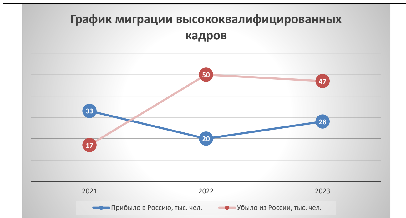
Рисунок 2 - График миграции высококвалифицированных кадров, тыс. чел. [1]