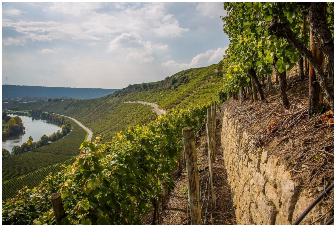
Рис. 2. Террасирование виноградников