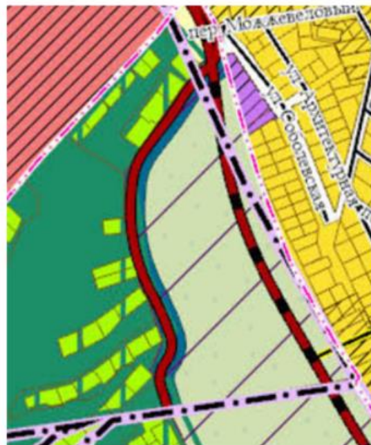
Рис. 3 – Анализ изменений в Генеральном плане