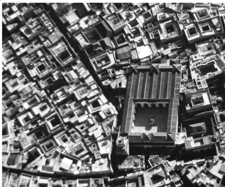
Рис. 1. Медина Феса

Традиционные марокканские городские дома строятся вокруг центрального пространства, которое является основным элементом вентиляции и солнечного света в доме, вокруг которого формируются многочисленные комнаты, которые шире, чем глубже. Это центральное пространство образует своего рода интерьеризированный фасад. Полы в нём чаще всего настилаются, но могут быть также сделаны из дерева, камня, бетона или цемента. По сути, традиционные напольные покрытия не существуют сами по себе. По периметру двора могут располагаться колоннады, более или менее орнаментированные и обработанные, разграничивающие проходы и циркуляции внизу. Порттик, который кажется близким к колоннадам и портикам римских домов, заимствован из греческой архитектуры, но это означало бы забыть, что сам он вдохновлён Восточным домом. Следовательно, двор является центром дома, а также играет важную социальную роль в жизни семьи. Сердце дома, elwüsteldaâr , – это открытое пространство для отдыха, предназначенное в первую очередь для воссоединения семьи и расслабления.