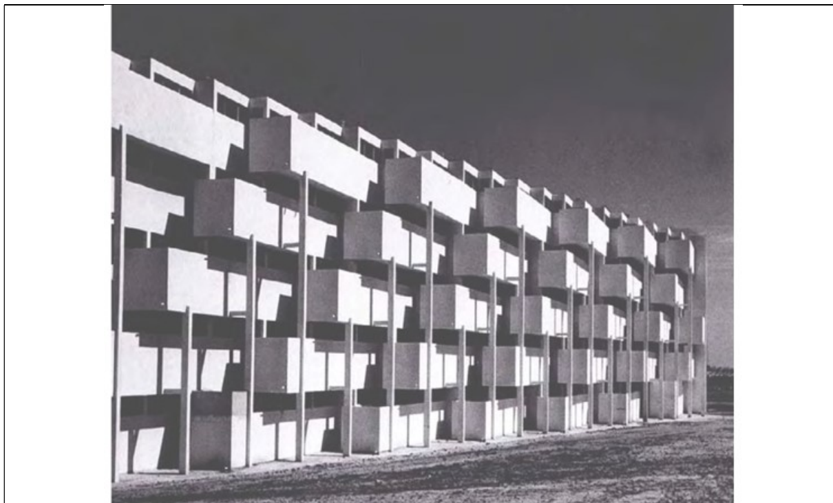
Рис. 4. Фасад адаптированного дома

Несмотря на разнообразие жилищных решений для большинства людей, существует общее чтение, например, концепции жилья, адаптированные для конкретных групп людей, с учётом различий в образе и стиле жизни, экономическом статусе, возрасте и гражданстве жителей. Также присутствует обилие промежуточных жилых пространств, таких как террасы,