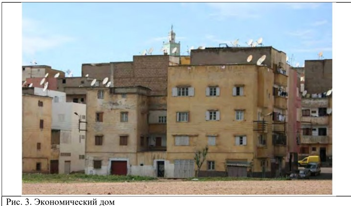
Рис. 3. Экономический дом

Помещения, используемые для личной гигиены, имеют различные решения, но мы заметили, что почти систематически туалет отделен от самой ванной комнаты. Часто, если позволяет пространство, туалет увеличивают вдвое, чтобы обеспечить личное пространство для гостей, не нарушая приватности дома. Сегодня биде обычно не встречается в западных ваннных комнатах, но оно по-прежнему находит место в городской среде Марокко.